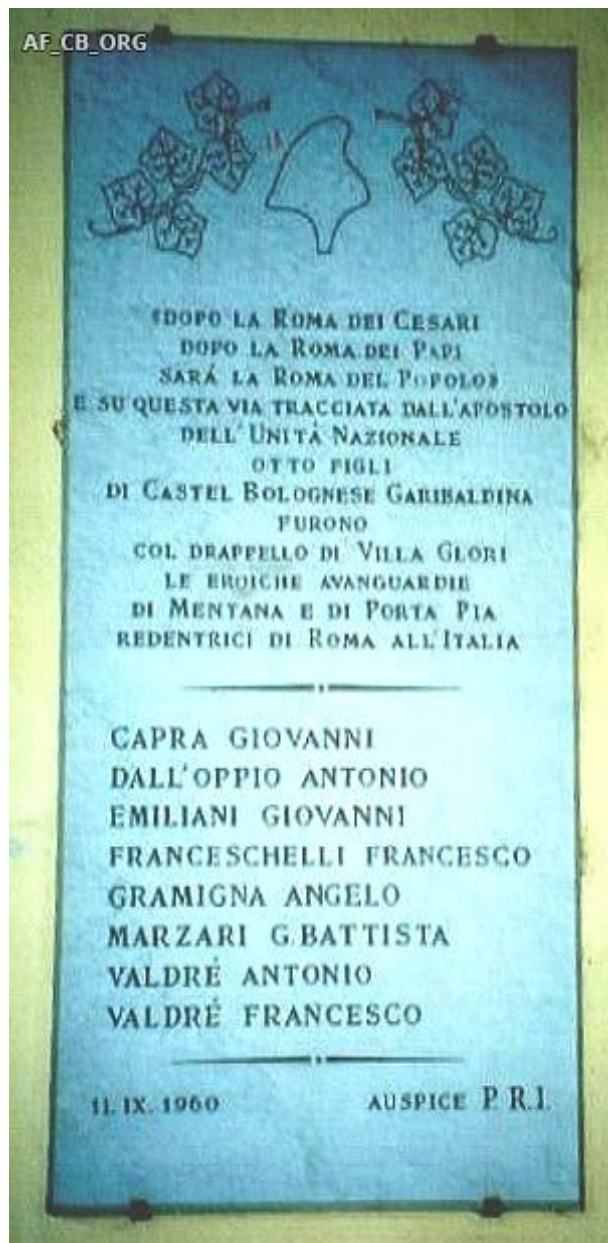
La lapide che ricorda gli 8 Castellani che parteciparono al Fatto d'Arme di Villa Glori (Castel Bolognese, loggiato della Residenza Municipale)