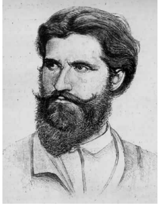
Amilcare Cipriani (1844-1918)