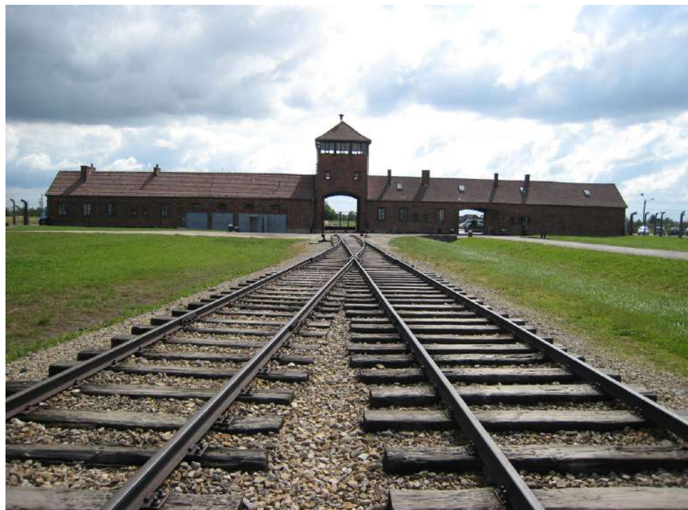
Auschwitz - Birkenau

All'interno dei campi il triangolo nero contrassegnava, oltre agli asociali generalmente di nazionalità te-