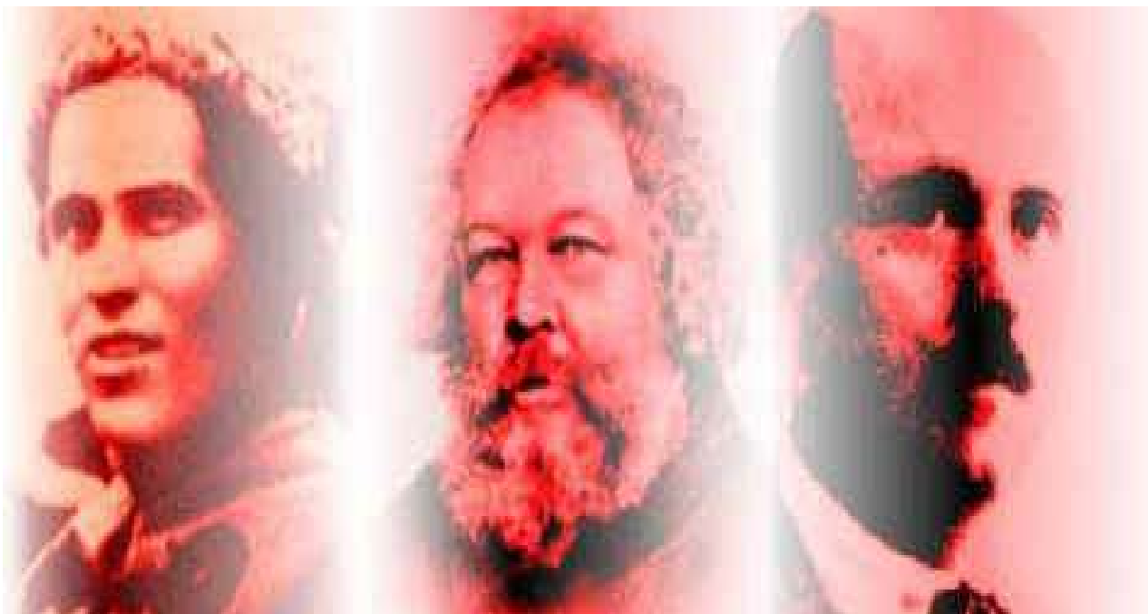
Nestor Makno - Michail Bakunin - Luigi Fabbri

sto i natali politici anche di Giorgia Meloni.